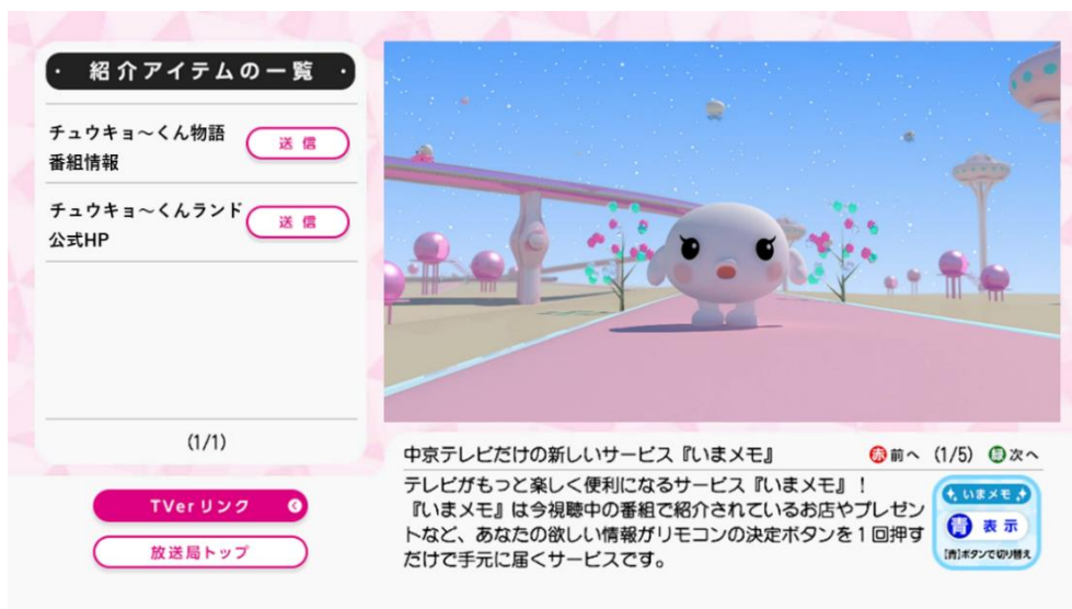
図2：データ放送画面